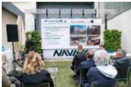
La presentazione dei dati dell'indagine Demopolis-Navigo

Il 38% delle imprese della nautica è ottimista sulla crescita del settore nel prossimo triennio. Per il 67% l' attenzione all'ambiente rappresenta un'opportunità di crescita aziendale e oltre un terzo immagina il successo occupazionale di esperti in eco-sostenibilità ed economia circolare. Sono alcuni dei dati illustrati al Versilia Yachting Rendez-vous durante la presentazione dell'indagine sui "fabbisogni occupazionali e di servizi nel settore della nautica", realizzata da Demopolis , in collaborazione con Navigo e i partner del progetto Action , promosso in seno al programma di Cooperazione Transfrontaliera Marittimo Italia-Francia.